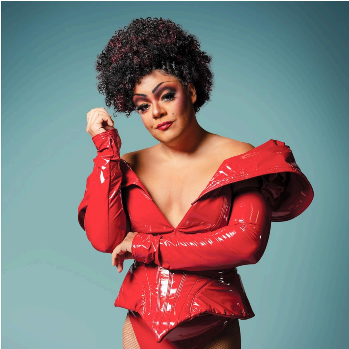
Meezingen met hits van Cyndi Lauper.