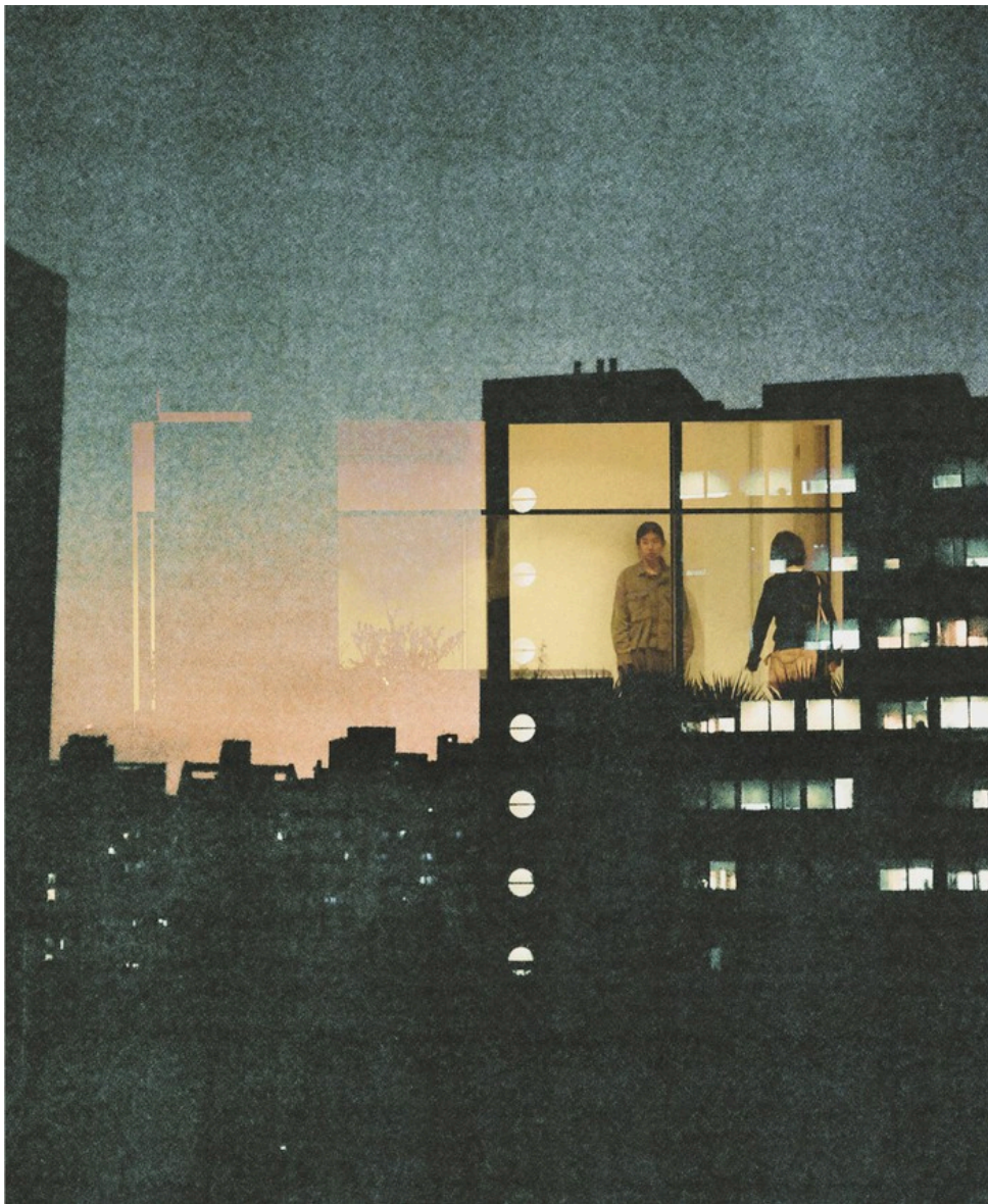
'Living apartment together' zal op locatie worden gespeeld, details volgen nog.