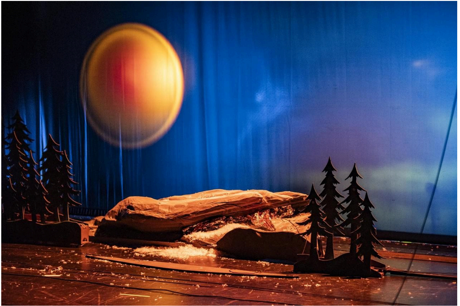
Magisch figurentheater.

Waar en wanneer? 12/1 in 30CC, Leuven. 15-17/1 in De Maan, Mechelen. 19/1 in CC Muze, Heusden-Zolder. 12/2 in De Grote Post, Oostende. 19, 22 en 23/2 in Het Paleis, Antwerpen.