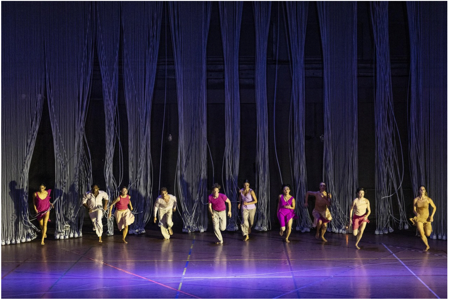
Ga dat zien: 'Rain' is dansgeschiedenis.