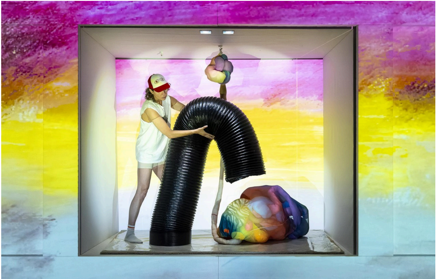
Opgelet: 'Songsofsongs' wordt geen zondagsschool.