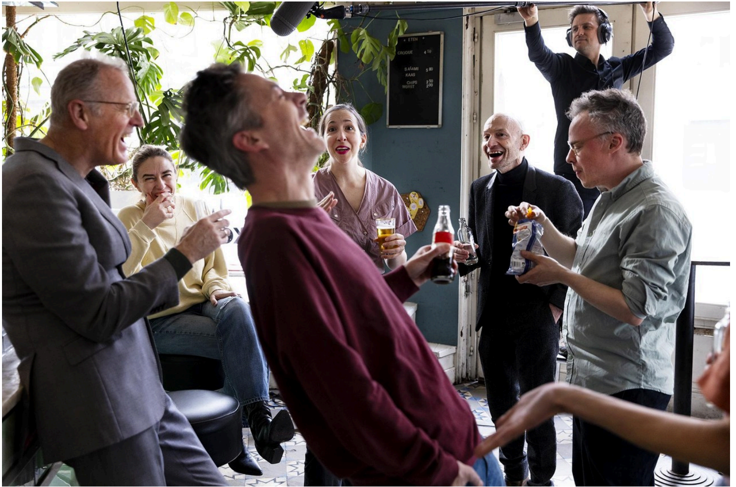
Tijd voor een reünie van 'De sitcom'.