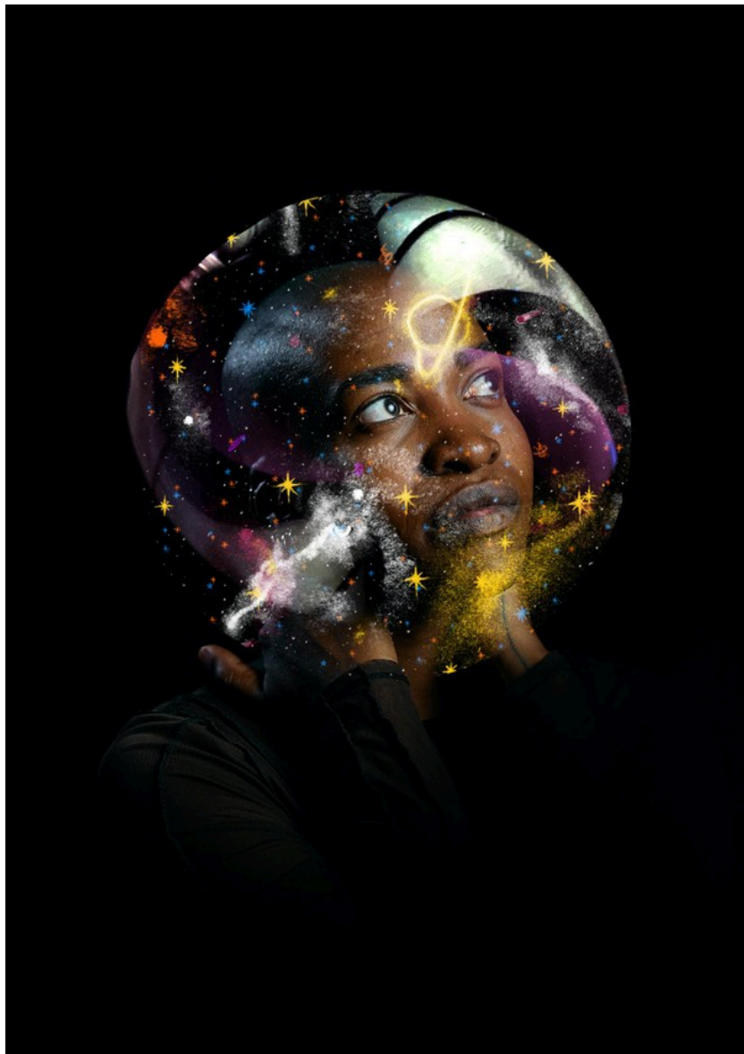
Fatilou verschijnt en verdwijnt.